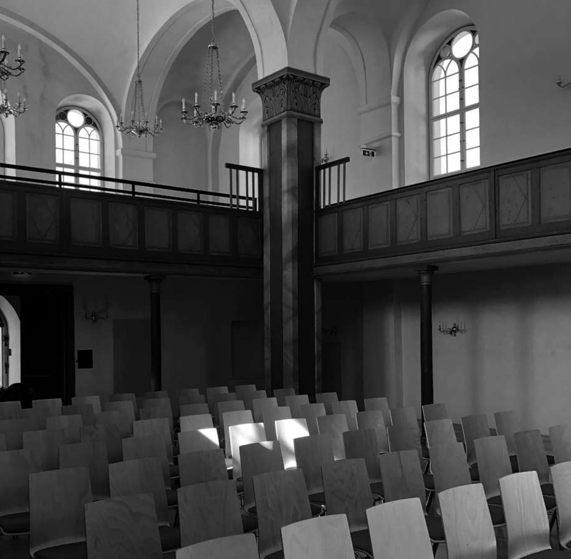
Innenansicht der ehemaligen Synagoge Kobersdorf.