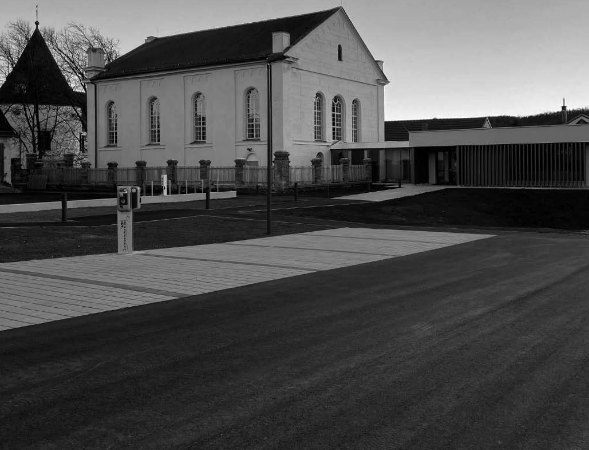
Haupteingang zur ehemaligen Synagoge Kobersdorf.